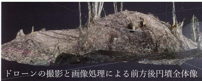
ドローンの撮影と画像処理による前方後円墳全体像