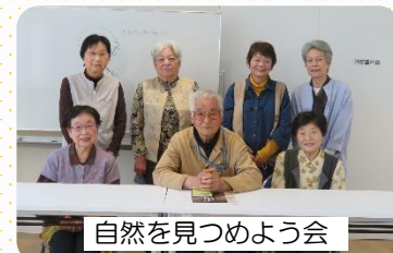
自然をみつめよう会