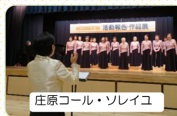
庄原コール・ソレイユ