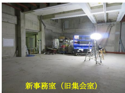
新事務室 (旧集会室)