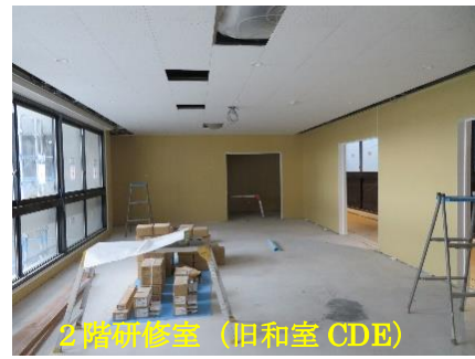
2階研修室 (旧和室 CDE)