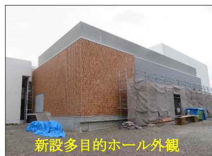
新設多目的ホール外観