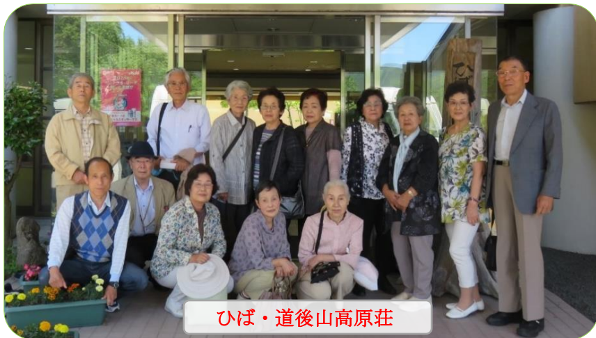
ひば・道後山高原荘