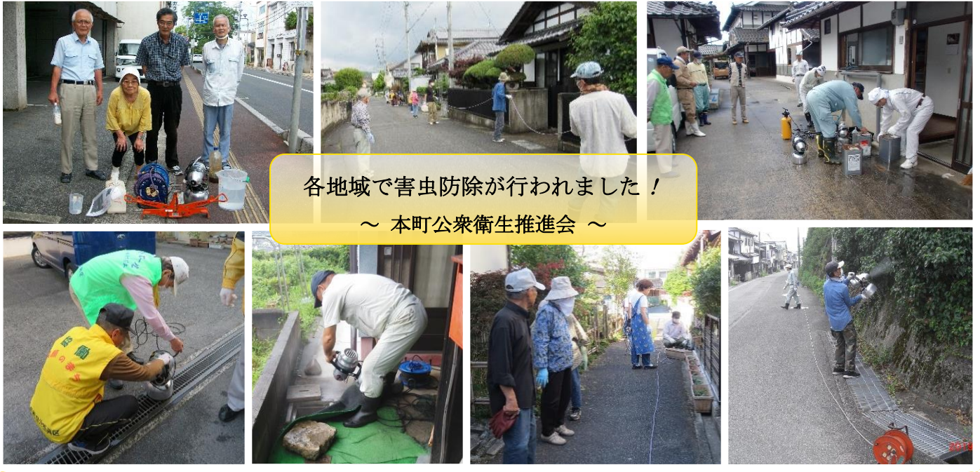
各地域で害虫防除が行われました！ ～ 本町公衆衛生推進会 ～