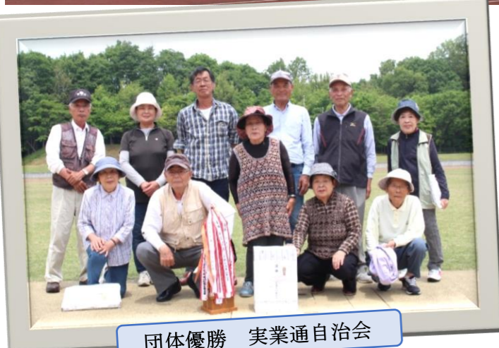
団体優勝 実業通自治会