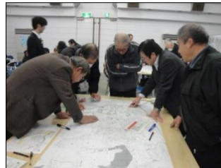
防災研修「地域を知ろう」