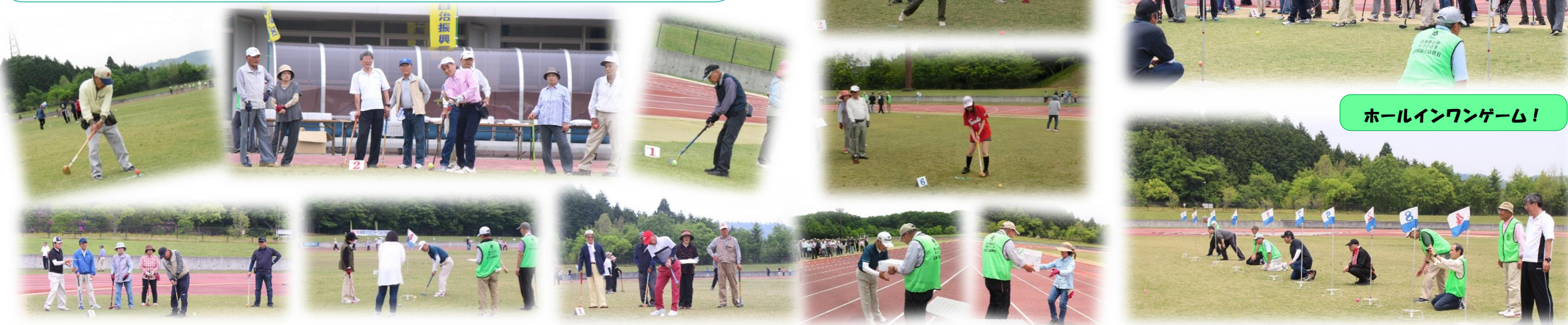
ホールインワンゲーム!

大会にご協力頂いた庄原地区体育協会の皆様や、関係者の皆様に厚くお礼申し上げます。