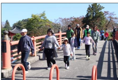
区民ウォーキングの集い