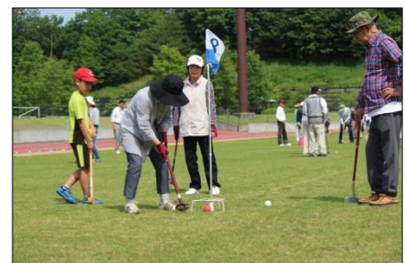
区民グラウンド・ゴルフ大会