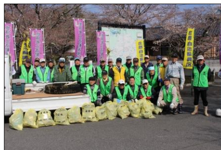
上野池クリーン作戦