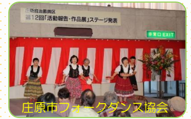
庄原市フォークダンス協会