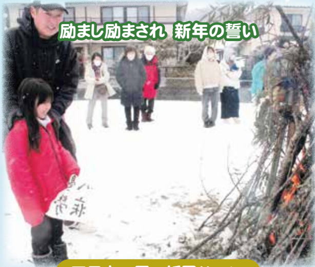
励まし励まされ 新年の誓い