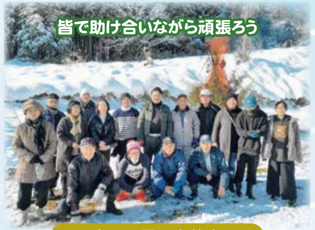
皆で助け合いながら頑張ろう