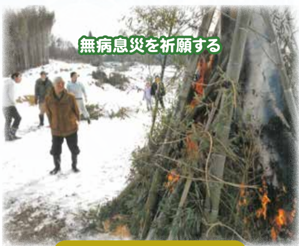
無病息災を祈願する