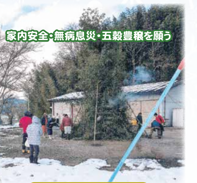
家内安全・無病息災・五穀豊穰を願う