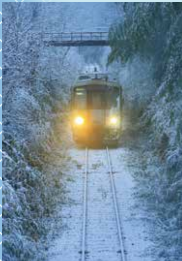
(一番列車) 土屋 詔二