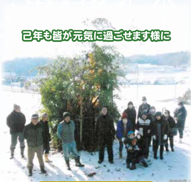
己年も皆が元気に過ごせます様に