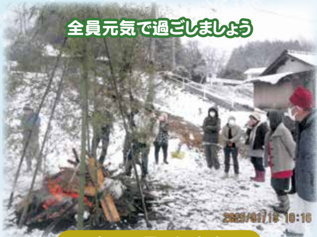
全員元気で過ごしましょう