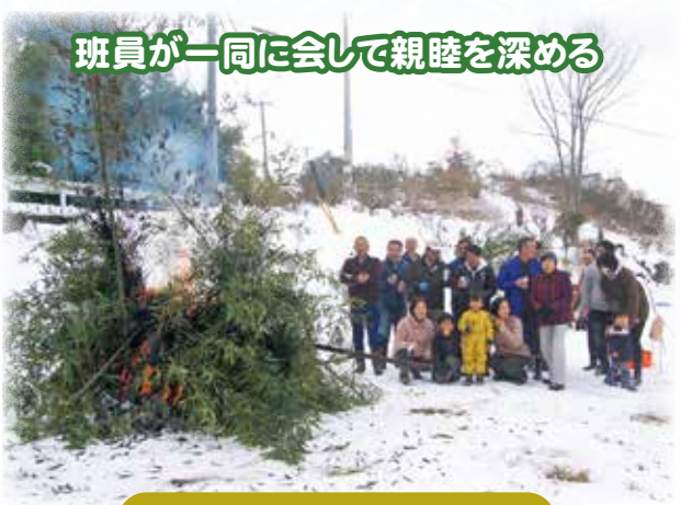
班員が一同に会して親睦を深める