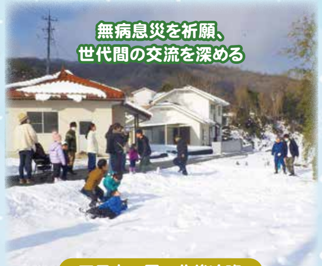
無病息災を祈願、 世代間の交流を深める