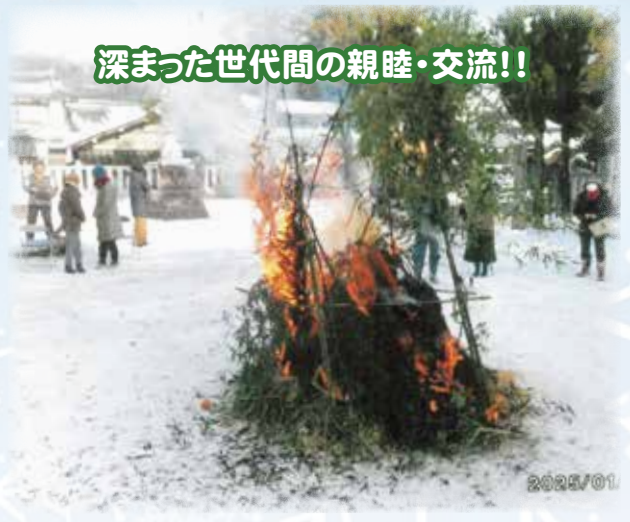
深まった世代間の親睦・交流!!