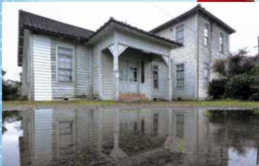
(リフレクション) 山岡 隆信