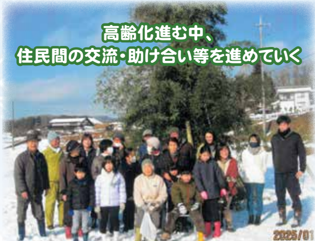
高齢化進む中、 住民間の交流・助け合い等を進めていく