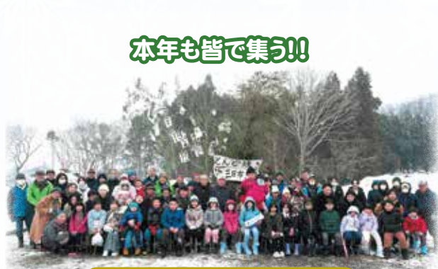
三日市三区自治会