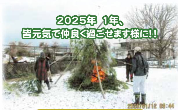
三日市二区 栄町班