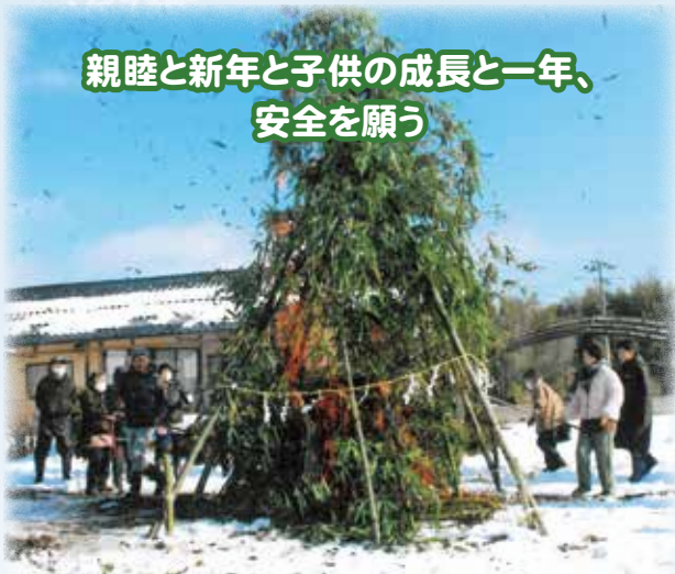
親睦と新年と子供の成長と一年、 安全を願う