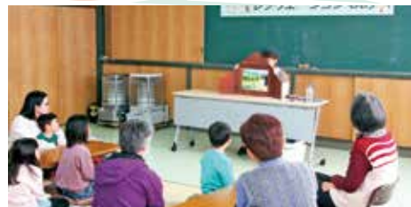
2/18 みんな集まれ！レクリエーションday