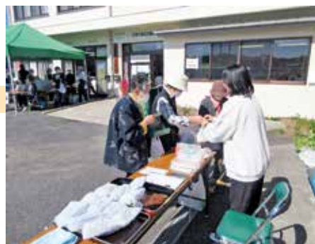
【写真2】 ふるさと祭での東豆腐の販売

以上のような内容を進めてきましたが、地域への加工技術の普及まではなかなかできずジレンマを感じています。また、地域を巻き込んで事業を推進することの難しさも感じています。地域課題が何なのかをしっかりと捉えて解決するための組織を作り進めないといけないと思えます。