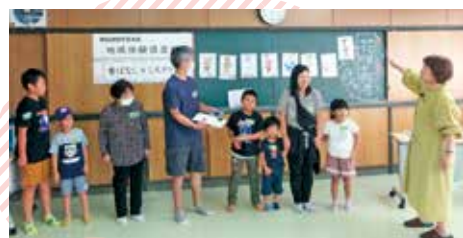
10/1 昔ばなし×ミステリー