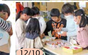
12/10 かんたん！リースづくり