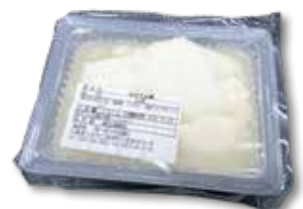
佐々木豆腐店委託製造の東豆腐