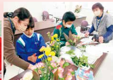
3/6 中学部のみなさんと フラワーアレンジメント