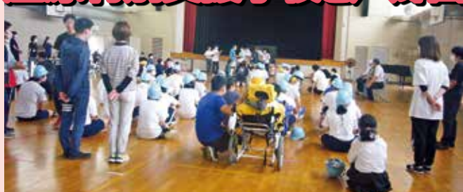
9/15 戸郷団地自治会が参加し、避難訓練

毎年、庄原特別支援学校では、「地域に学ぶ交流活動事業」として戸郷団地や女性部と交流活動を行っています。