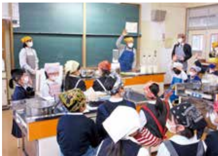
豆腐づくりの説明