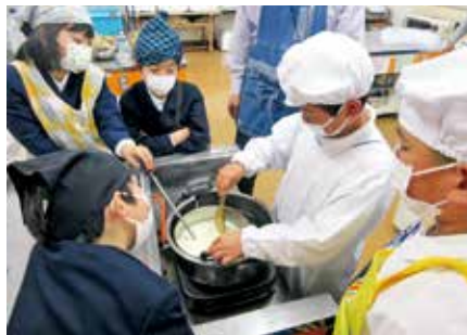
所定の温度まで豆乳の加熱