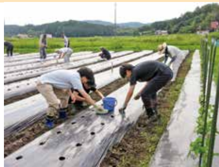
【写真1】 県立広島大学2年生による種まき

大豆栽培に特化して10年継続してきました。例年80kg程度の大豆がとれています。収穫した大豆（フクユタカ）は、東振興区の手づくり味噌や豆腐に使っています。味噌づくりは、2月の行事として定着しており、これからも昔ながらの手づくり味噌を味わって頂きたいと思えます。また、地産地消に向けて1昨年に取り組んだ16種類の大豆の栽培試験の結果6種類に絞り込むことができ、今年度は、県立大学の3名の学生が6品種を栽培（写真1）し、種子の増産に関わってくれました。来年度（令和6年度）は、その種子を東地区の希望者に譲りたいと思えます。（詳細は新年度に報告）