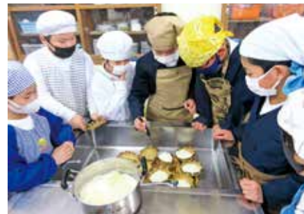
豆腐をザルに移しているところ