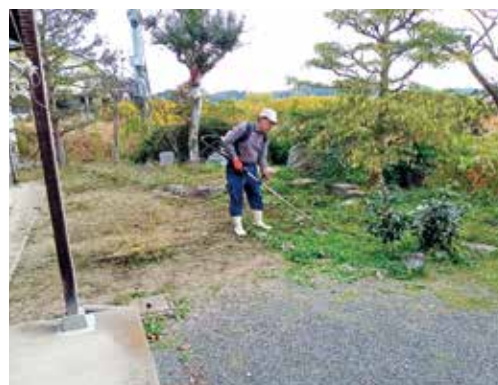
庭の草取りや草刈の支援