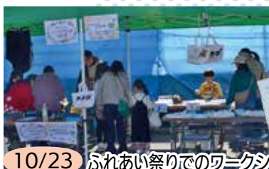
10/23 ふれあい祭りでのワークショップブース 『オリジナルトートバックづくり』