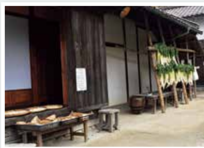
【晩秋】 在本 功夫