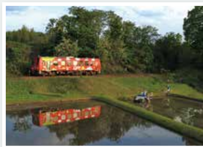
【中断】 山岡 隆信