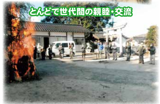
三日市二区 上組班