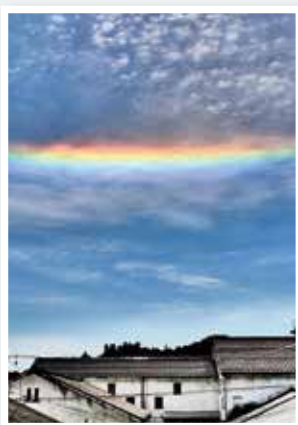
【酒蔵の虹】 田辺 靖雄