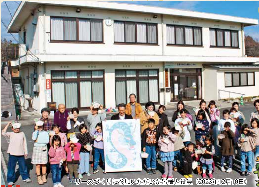
リースづくりに参加いただいた皆様と役員 (2023年12月10日)

●発行/庄原市東自治振興区 ●編集/東自治振興区編集委員会 TEL 0824-72-2854 ●【ホームページ】 http://shobara-higashi-jichi.com ●印刷/シンセイアート株式会社