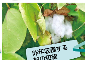
昨年収穫する前の和綿