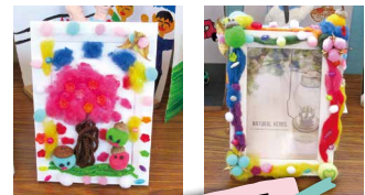
染色した綿でつくる卒業記念品制作