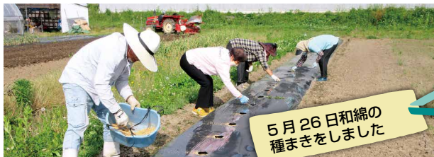
5月26日和綿の種まきをしました