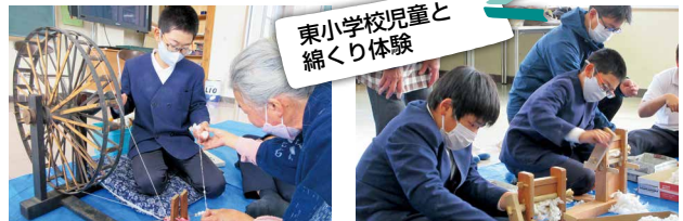
東小学校児童と綿くり体験