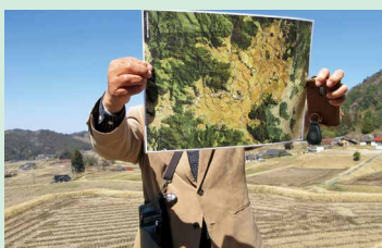
三河内「棚田遺産」に登録