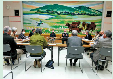
比和自治振興区さんと意見交換