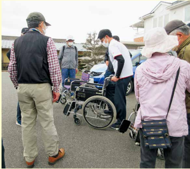
ボレロの家 職員さんに車椅子の使用 方法を教えて頂きました

三日市(一区・二区・三区)・戸郷団地と各自治会自主防災会の皆様と、医療法人社団聖仁会の愛生園とボレロの家の職員さんにもご協力頂き、庄原市指定避難所になる備北丘陵公園までの道を車椅子と徒歩で実際に歩いてみました。介護施設ボレロの家の職員さんから車椅子の使用方法や、登り坂や下り坂を安全に運転する方法等、アドバイスを頂きました。