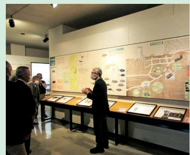
比和自然科学博物館 見学