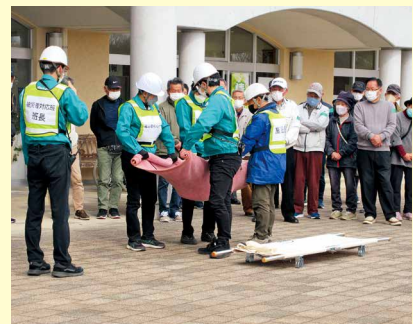
担架(毛布)搬送訓練

当日は穏やかな小春日和となり、この訓練に東地区から約40名の方が参加され、沢山の方のご参加ありがとうございました。