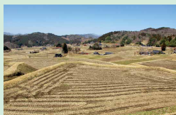
基盤整備後の棚田風景