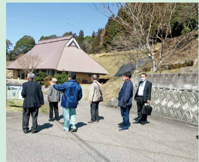
せとうち古民家 ステイズ「長者屋」