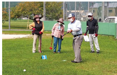
詳細は後日お知らせいたします！

開催日：令和5年5月27日(土) 場所：庄原市スポーツ広場 (旧ニッテツグラウンド) (老人部)