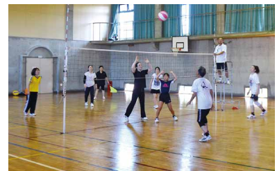
詳細は後日お知らせいたします！

開催日：令和5年6月4日(日) 雨天の場合：令和5年10月29日(日) (体育部)