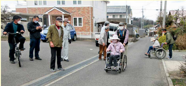
12:52 ボレロの家を出発

今回は想定時間よりも早く到着することができましたが、実際に災害が起こったとき、地域で協力し、より早く、より安全な避難ができるよう、今後も訓練を続けていくことが大切だと感じました。