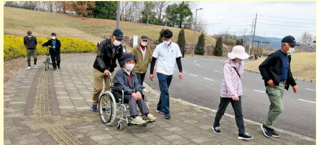
13:25 愛生園を経由し、備北丘陵公園北入り口 ふらりへ到着