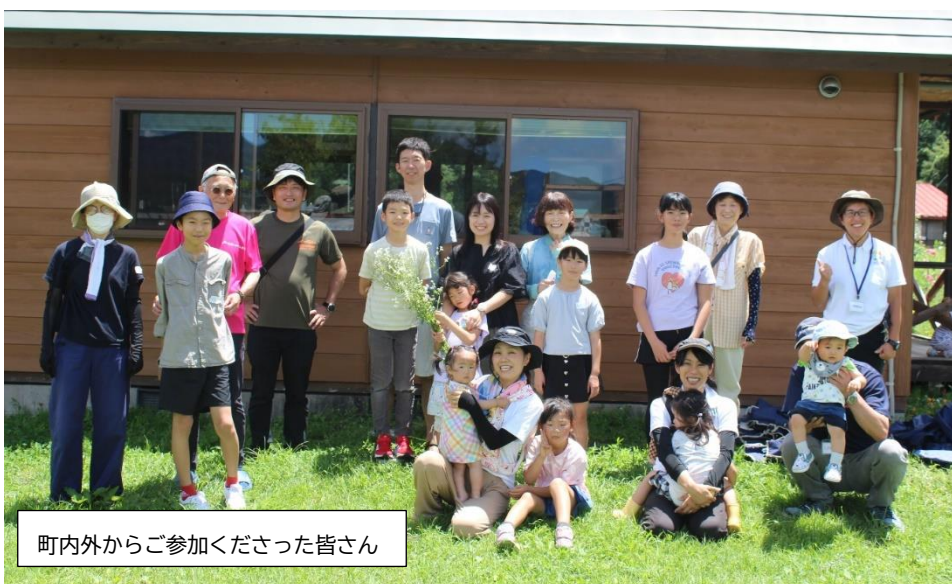
町内外からご参加くださった皆さん