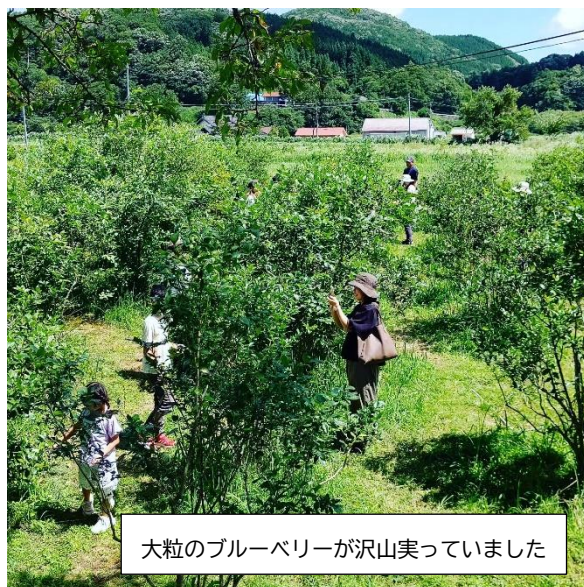
大粒のブルーベリーが沢山実っていました