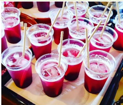
↑ サプライズでブルーベリースカッシュを頂きました！