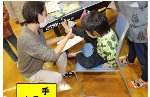
手形足形スタンプ ました こんな作品が できました