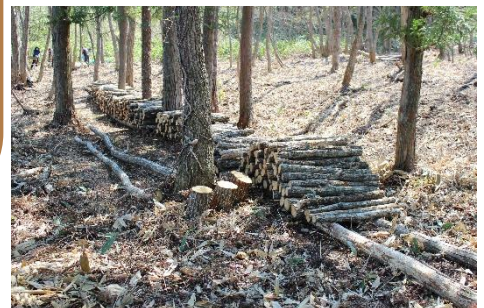
菌を打ったしいたけの木

4月29日のりんご塾は中止になりましたが 昨年から旧下高保育所にある山の活用を目的として計画していた しいたけの植菌を森林管理運営部会の人たちと行いました しいたけが4種類になめこも植菌しました 早いこのは秋の収穫予定です その時は収穫体験 収穫祭も出来たらいいなと思っています 原木なめこは本当に美味しいよ~ しいたけはどうやって食べたら美味しいかな?と収穫を楽しみに作業しました