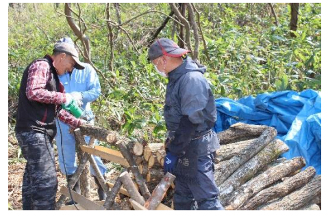
ホダ木にドリルで穴を開け