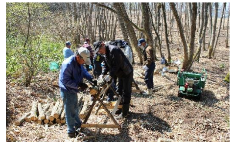
コマ菌を穴に埋め込み金づちで打ち込み