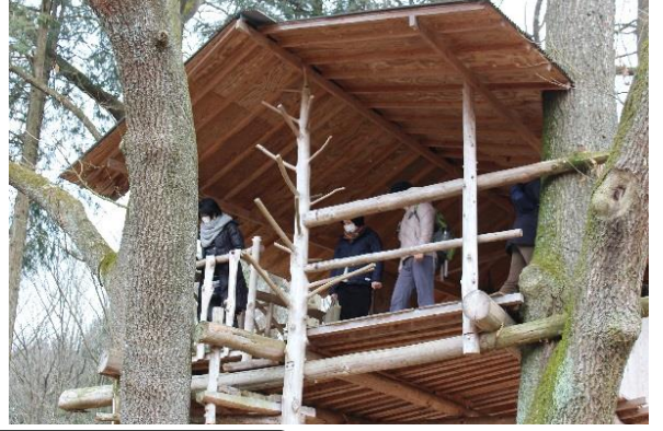
ツリーハウスに登らせていただきました!