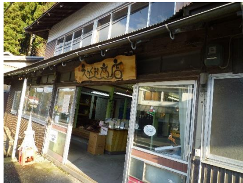
空き商店を利用し、つながろうプロジェクトから地域の集いの場として作られたえがお商店