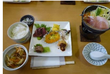
津黒高原荘で頂いた昼食 ローストビーフ・角煮・コロッケはしし肉でした