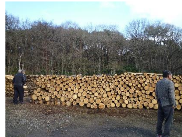
薪集積場 切り出された木がここに集まってきて、これを加工して納品