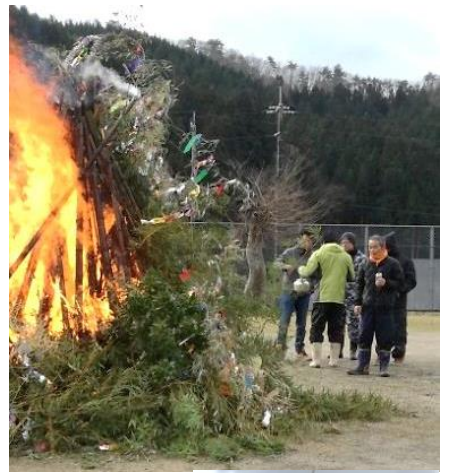
上湯川 下湯川地区

1月12日には南地区、1月13日には上湯川・下湯川地区、和南原地区、新市地区とそれぞれの地区でどんど焼きが開催されました。