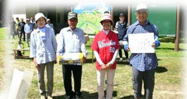
下湯川 A チーム