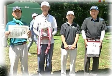
新市 A チーム

9月7日(土)各自治会から、23チーム・92名の参加で盛大に開催されました。天候にも恵まれ、皆さん和気あいあいとプレーされました。個人の部の成績上位男女各5名の方は、高野町代表として、10月19日(土)に行われる第14回庄原市民健康づくりグラウンド・ゴルフ大会に出場されます。ご健闘をお祈りします。