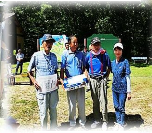
和南原 A チーム