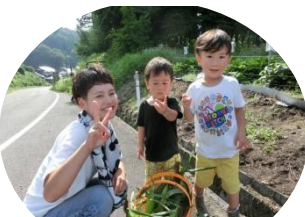
たくさんとったよ