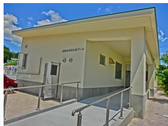
管理室・更衣室・トイレ