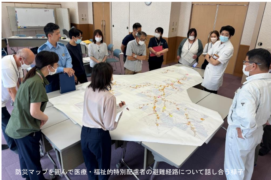
防災マップを囲んで医療・福祉的特別配慮者の避難経路について話し合う様子