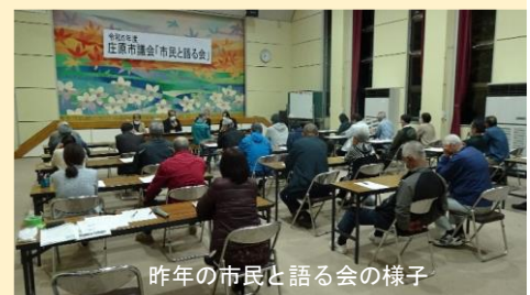
昨年の市民と語る会の様子