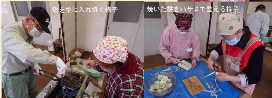
餅を型に入れ焼く様子