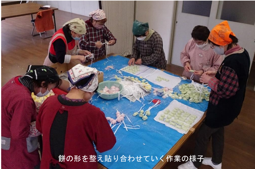
餅の形を整え貼り合わせていく作業の様子

稲草西自治会老人部のメンバーによる「とうろう菓子」づくりが、3年ぶりに高齢者活動センターにおいて行われました。作業3日目となる2月11日(土)には、赤、黄、緑に着色し小さく切った餅を提灯やまりの半分の型に入れて焼き、ハサミで形を整え、紙ひもを挟んで貼り合わせ、梱包までの工程を終日かけて約50セット完成しました。