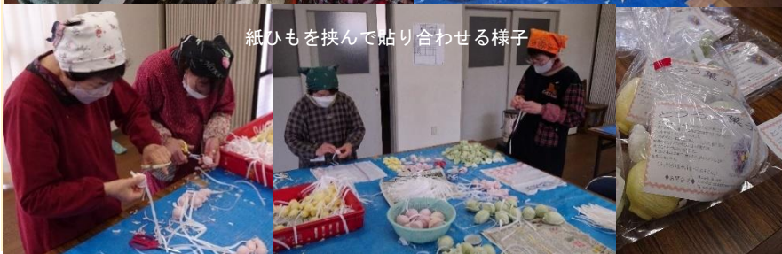
紙ひもを挟んで貼り合わせる様子