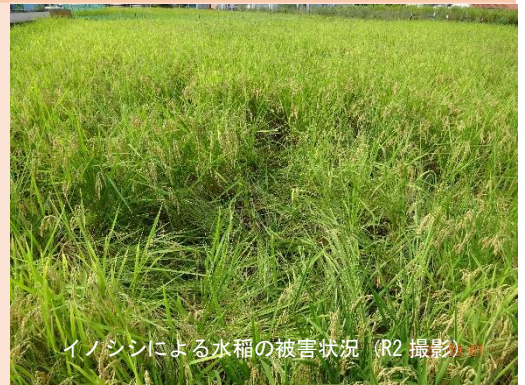
イノシシによる水稻の被害状況（R2撮影）

また、新聞報道でツキノワグマの目撃情報がありますが、町内でもクマの痕跡らしいものや、実際の目撃情報が市に数件寄せられています。収穫しない栗や柿は、野生動物に餌付けの原因となっています。山に入るときは、気をつけてください。