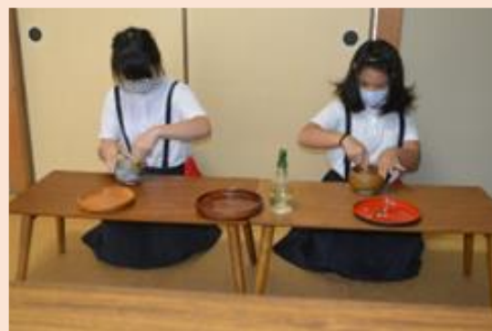
上手にお抹茶を点ててくれました。