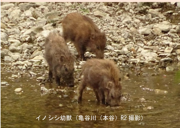
イノシシ幼獣（亀谷川（本谷）R2撮影）