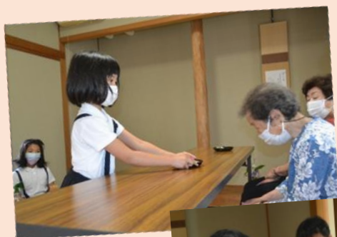
1年生は初めての お茶会にチョッピリ 緊張していました。