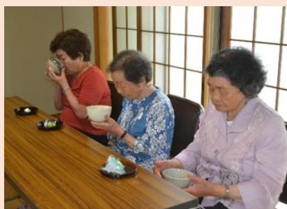
おいしいお抹茶をいただきました。