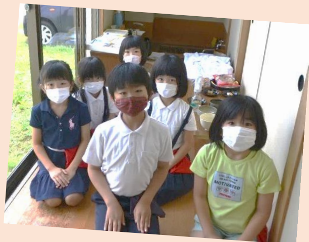
出番まで静かに待ちます。 ちょっとドキドキ・・・