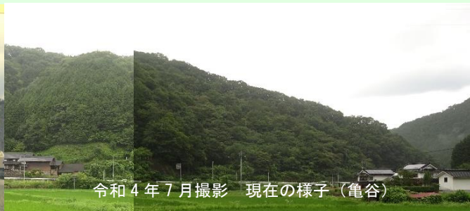
令和4年7月撮影 現在の様子（亀谷）