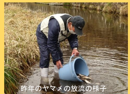
昨年のヤマメの放流の様子

今年も3月1日（火）のヤマメ釣りの解禁に向け、2月27日（日）田総川漁協の役員を中心とする組合員が、田総川（五箇）、領家川、亀谷川（黒目）に300kgのヤマメを放流します。