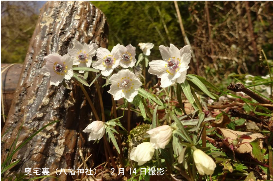
奥宅裏（八幡神社） 2月14日撮影