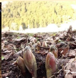
アースワーク河川公園