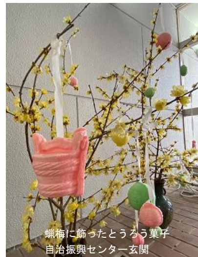
蠟梅に飾ったとうろう菓子 自治振興センター玄関