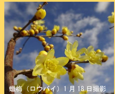
蠟梅（ロウバイ）1月18日撮影

本年も役員、スタッフ一同、一致協力して、安心・安全なまちづくりに邁進してまいりますので、なにとぞご指導ご協力をお願い申し上げます。