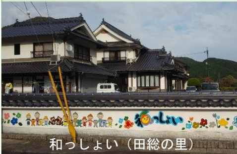
和っしょい (田総の里)

今回は稲草西自治会の中にある「和っしょい」と「あんだんて」さんを紹介しします。塀や石にカラフルでかわいい絵が描かれていて目を引くので、皆さんもご存じと思いますが、田総の里にある「和っしょい」さんはグループホームで、共同で生活しておられます。