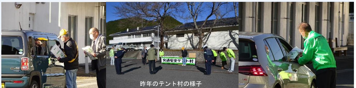
昨年のテント村の様子