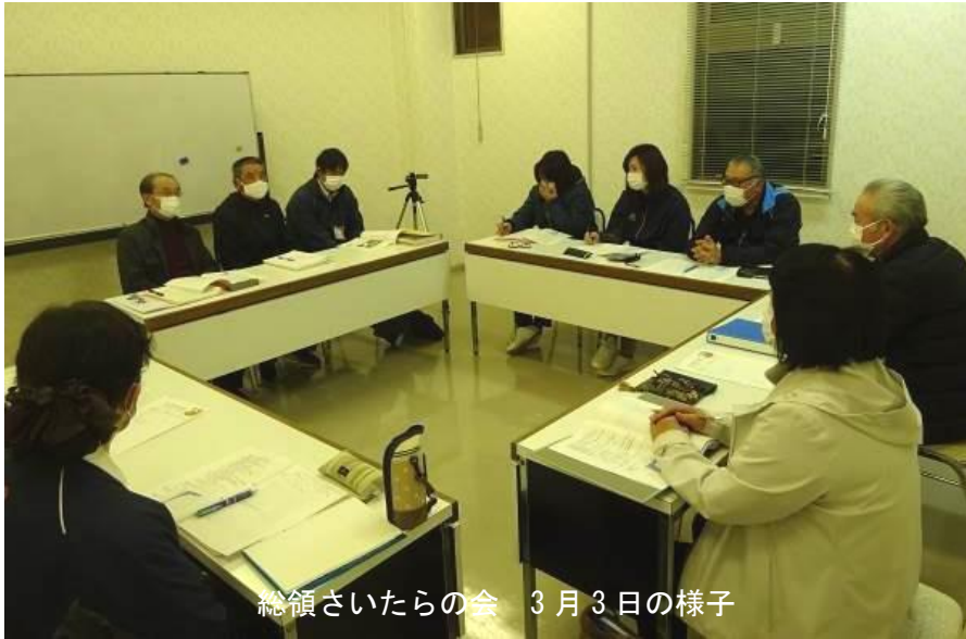
総領さいたらの会 3月3日の様子