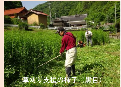
草刈り支援の様子（黒目）

今回のアンケートで、ごみステーションへのゴミ出し、バス停までの移動、買い物、理美容については、多様な「移動手段」の必要性が浮き彫りとなった形です。そのほか自由記述にも多様な困りごとが寄せられています。自分たちが歳を重ねても、この地域で安心して暮らせる仕組みづくりができるよう、関係機関と協力しながら話し合いを続けていきます。