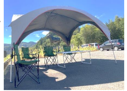
ドーム型テント 比和に集マルシェで使用

自治会行事や 町内イベントに 個人やグループ で使用できます。 ※詳細は回覧を ご覧ください