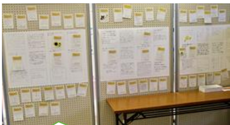
高齢者からの返信メッセージを掲示

広報やチラシにて実施事業をお知らせしますので多くの方のご支援、ご協力を頂きますよう よろしく願いいたします。