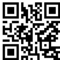
比和自治振興区ホームページQRコード