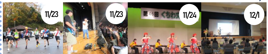
11/23 走ろう会 駅伝大会