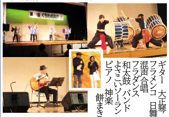
ギター 大正琴 フラメンコ 日舞 混声合唱 フラダンス 和太鼓 バンド よきこいソング ピアノ 神楽 餅まき