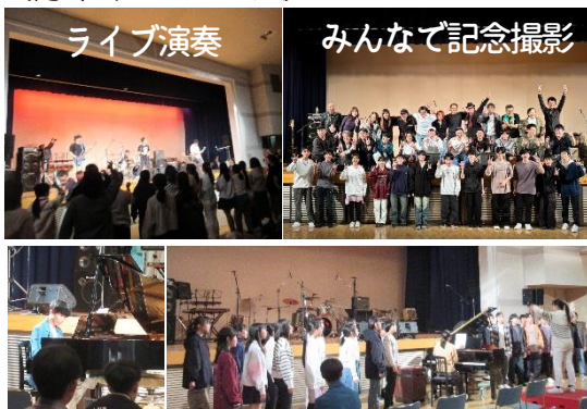
ライブ演奏 みんなで記念撮影 ピアノ 合唱