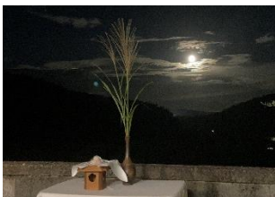
「中秋の名月@新月マルシェ」