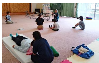
【写真右】骨盤ケア体操とカイロプラクティック体験