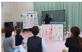
【写真左】参加者の質問に答えながら体の仕組みを解説