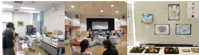
子ども服リサイクル