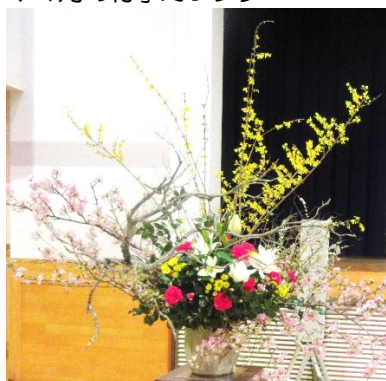
撮影日 3月2日 「くちわのつどい」で ステージを飾った生花