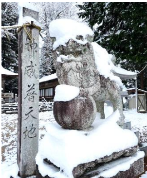
「多加意加美神社の狛犬」 撮影日 11月18日（月）