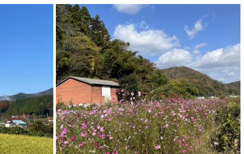
金田のコスモス畑