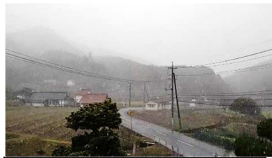
11月に雪が積もった! 撮影日 11/18 (土)