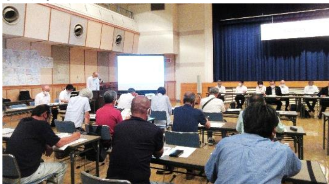
(8/23 自治振興センター)

「地域包括ケアシステム」では、口和で地域の課題解決について話し合う「ぬくもり会議」を紹介しました。