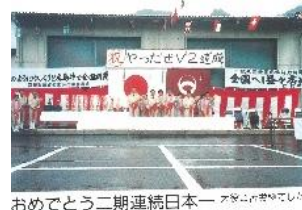
おめでとう二期連続日本一受賞おめでとう

第4回(昭和57年)、第5回(昭和62年)に2期連続で日本一に輝いたのを受け「和牛日本一の町」となりました 資料「空からみたふるさと口和」平成元年