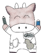
「もうむ」 口和小学校