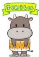
「ちくわうしくん」 庄原市文化協会口和支部