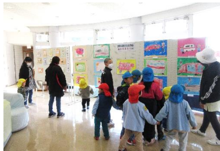
口和自治振興センター (聖慈保育所)

三次消防署口和出張所では、秋の全国火災予防運動の一環として、消防車を写生した幼年消防クラブ員である園児たちの作品を展示しました。