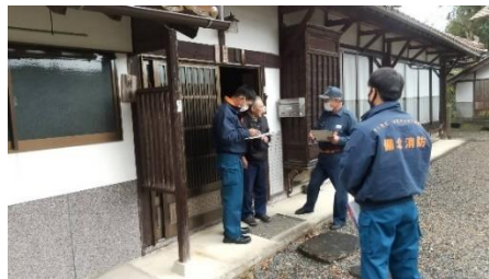
高齢者世帯を訪問し 火災報知器の点検