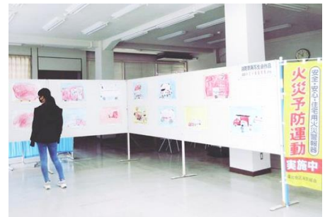
庄原農協口和支店 (みどり園保育所)