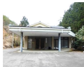
【庄原市口和斎場】 平成2年度建設