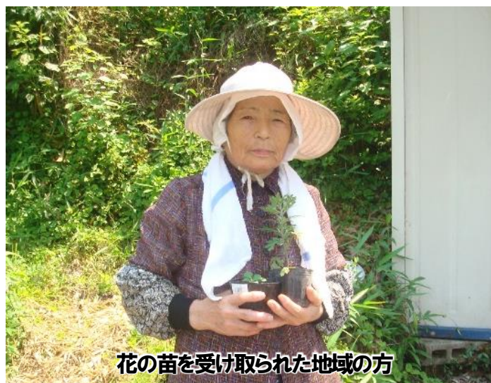
花の苗を受け取られた地域の方