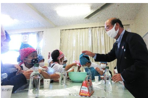
口南小学校防災教室