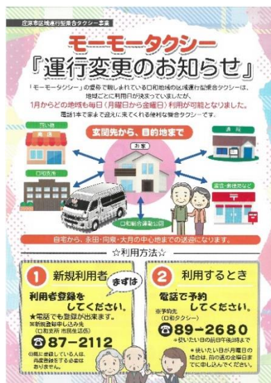
モーモータクシー運行変更のおしらせ