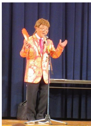
せらの公路あやまろう