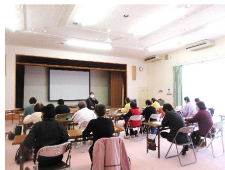
人権啓発 DVD 上映