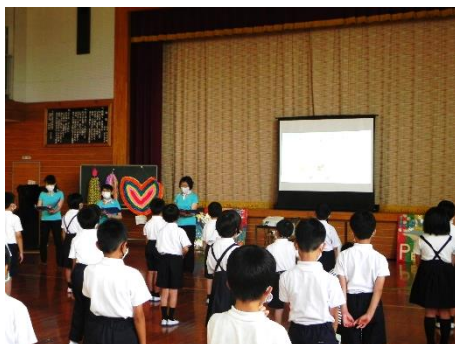
被爆体験記朗読会