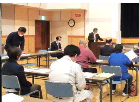
空き家有効活用研修会