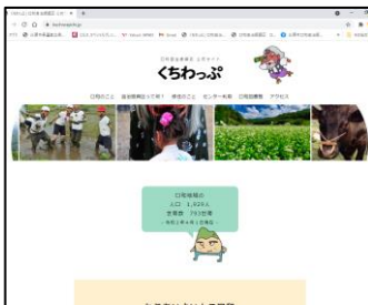
公式ホームページ「くちわっぷ」