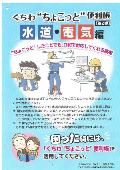
くちわ“ちょこっと”便利帳