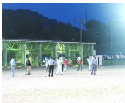
シニアグラウンドゴルフ大会