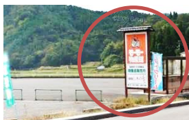
大月：モーモー物産館