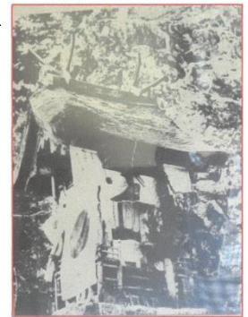
昭和 15 年頃の釜峰神社