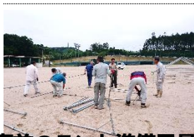
事前のテント準備風景

昭和45年から始まり今年で48回目を迎える「口和体育祭」が5回目の中止となりました(前回の中止は平成28年)。会場準備と片付けに携わっていただいた皆様に感謝申し上げます。来年は運動公園で会いましょう!