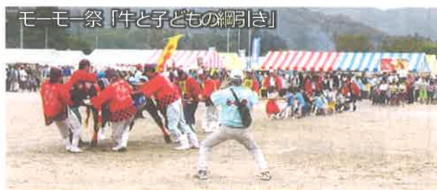
モーモ一祭「牛と子どもの綱引き」