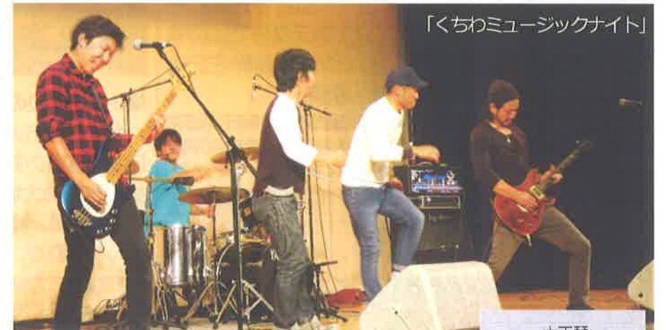
「くちわミュージックナイト」