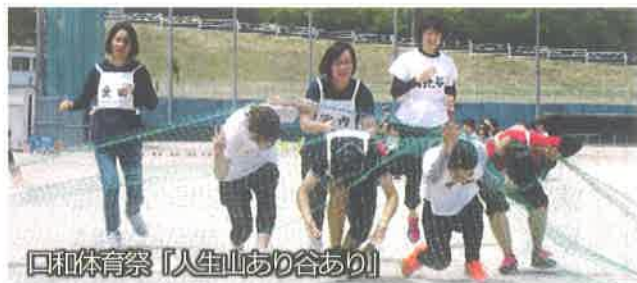
口和体育祭「人生山あり谷あり」

皆様方には、ご健勝にて新年をお迎えください。来る年も何かとよろしくお祈りします。