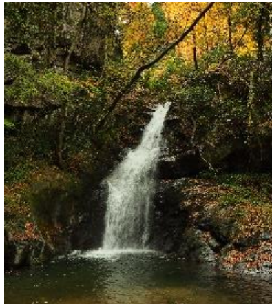
宮内桑垣内地域から流れる宮内川の支流にある滝