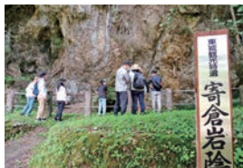
帝釈峡最大岩陰遺跡