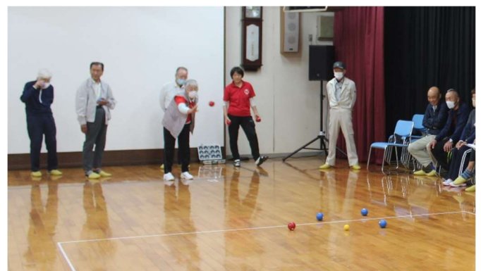
ルールは難しくなく誰でも参加できます