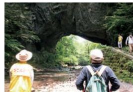
国指定 天然橋 雄橋