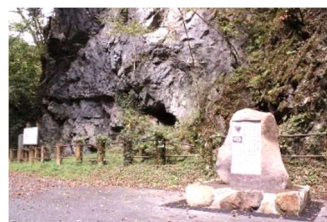
帝釈峡馬渡遺跡と モニュメント