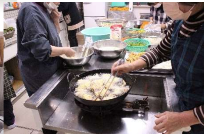
黙々と揚げる。ご苦労様でした。