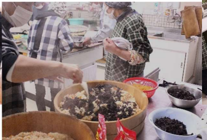
混ぜるといいかおり、香茸ごはん。