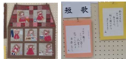
コロナ禍でイベント消えし人里を窓に流れる 百景たのし